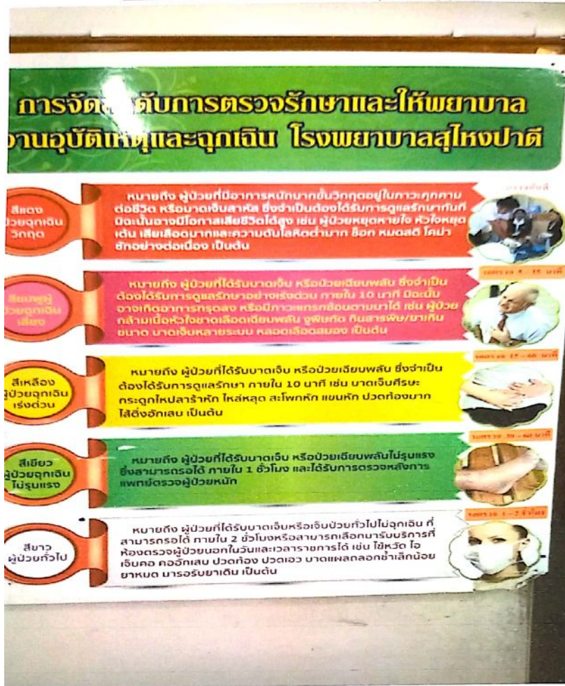
ภาพขั้นตอนการให้บริการงานผู้ป่วยนอก